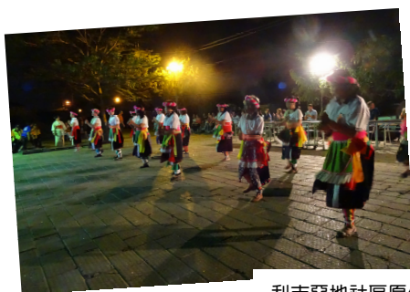
利吉惡地社區原住民熱舞迎賓。

此外，值此 0708 尼伯特颱風災害後各界關懷臺東之際，本活動不僅可深化全民對於國土永續管理之認同感，亦可喚起「擁抱臺東」的意識，展現對於大地的熱情，並對臺東地區觀光，促進地方經濟發展有所助益。