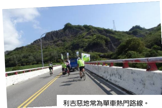
利吉惡地常為單車熱門路線。

相關訊息請見：地質知識網絡粉絲團 ( https://www.facebook.com/twgeoref )。