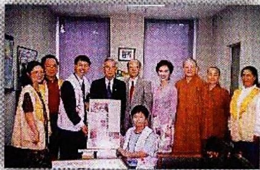
成立「熱愛生命獎學金」，提倡〈生命無價 愛無國界〉

論生命處於何種情境，活著都該有拒絕死亡的勇氣，那怕病魔再冷酷、肉體的折磨再痛楚，「我還有一隻腳」就要勇敢地走下去。但願大觀的出現，讓我們懂得互相關愛、懂得去親近孩子的天地。