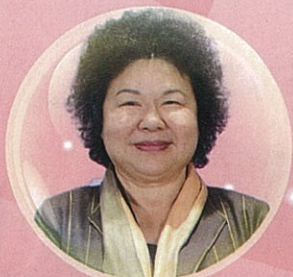
陳菊 / 市長 / 高雄市政府