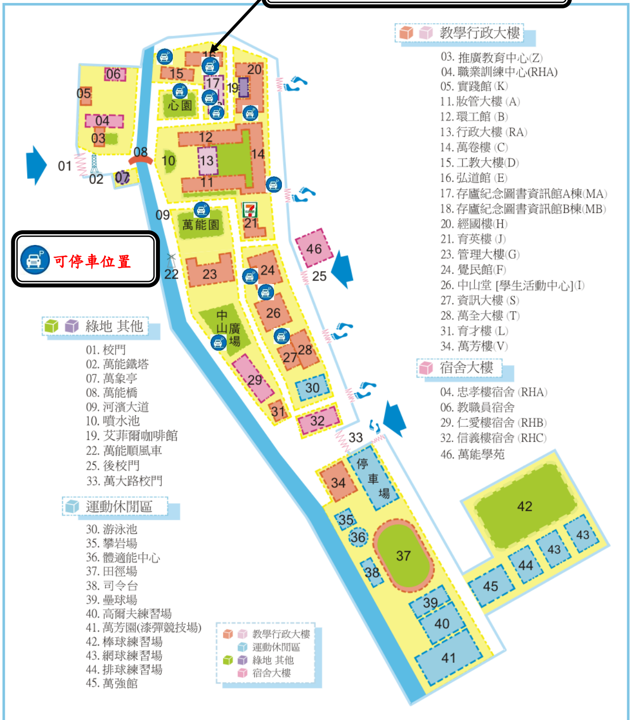
萬能科技大學校園地圖